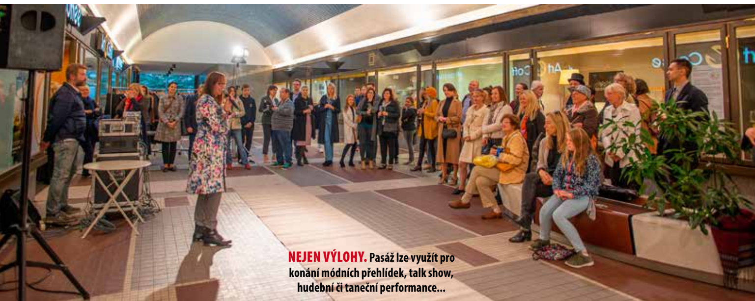
NEJEN VÝLOHY. Pasáž lze využít pro konání módních přehlídek, talk show, hudební či taneční performance...